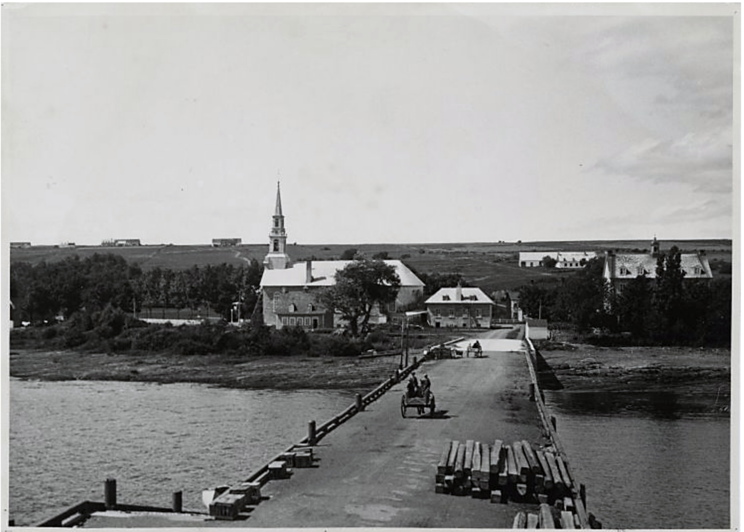
Saint-Laurent-de-l'Île-d'Orléans – Vue Patrimoine québécois [Vers 1925]

Collection initiale. Vue panoramique prise du phare sur le quai