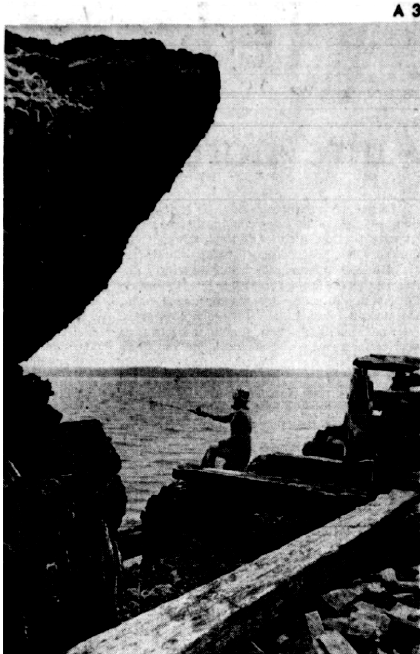
Le Soleil, J.-M. Villeneuve

1976 – Les quais sont la peste de l'Ile d'Orléans