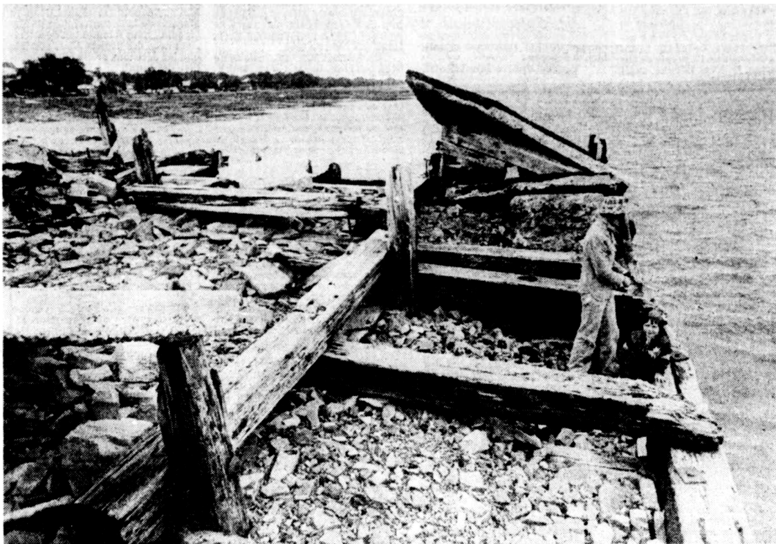
La réparation du quai de Saint-Laurent, comme dans le cas des autres quais de l'île d'Orléans, traîne depuis 1974.